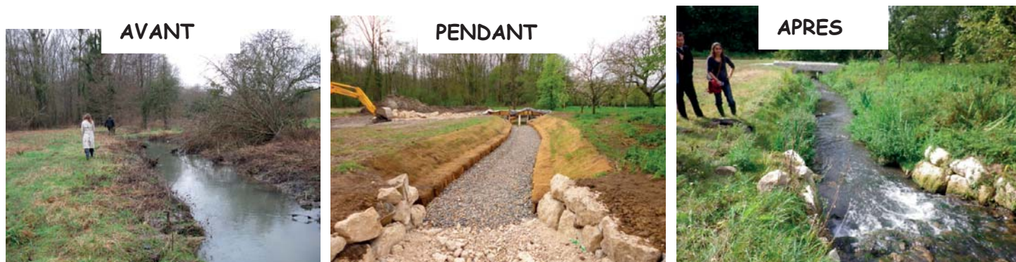
Exemple d'opération réalisée par le Syndicat de la Vallée de L'Orvanne entre Bichereau et Flagy

La Communauté de Communes du Gâtinais, la Communauté de Communes Moret-Seine-et-Loing, et le Syndicat du Haut Lunain vont engager une réflexion globale basée sur un diagnostic du Lunain qui débouchera sur un projet de restauration et de préservation des milieux aquatiques.